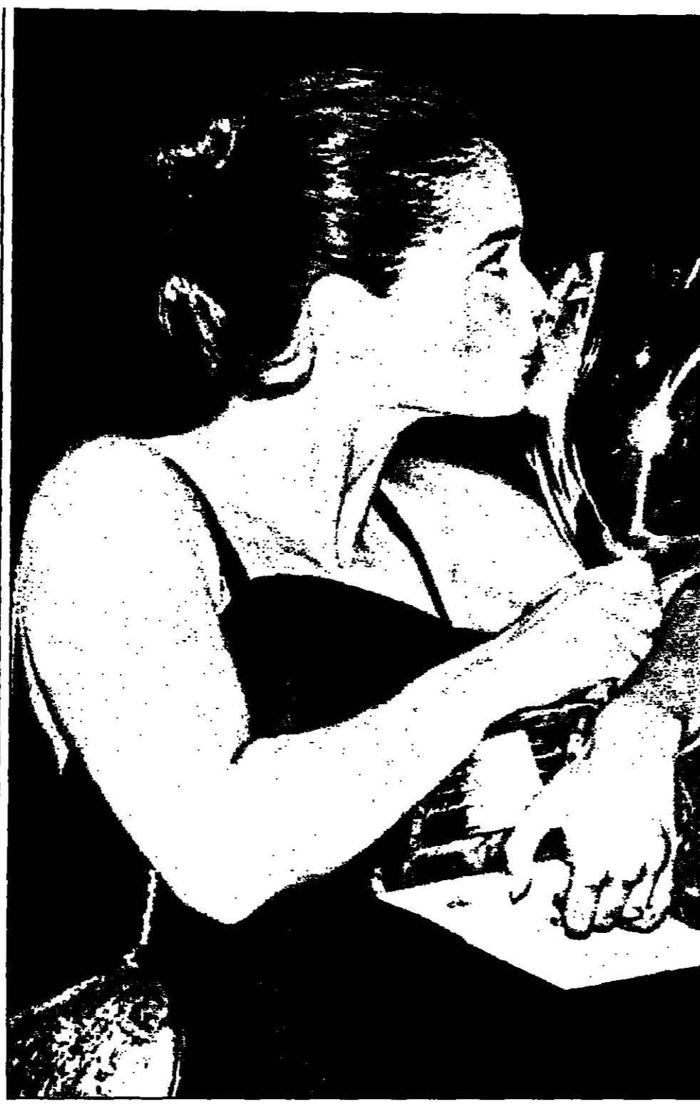
النجمة الأمريكية روبين صوفي فازت بكأس أفضل ممثلة في السينما الأمريكية المستقلة في مهرجان فينيسيا السينمائي عن دورها في فيلم فينغار... نيغاراه

أريد - الأردن - «القدس العربي» - شهدت مدينة اريد شمال الأردن جريمة قتل راح ضحيتها مواطنان توفيا على الفور، ففي حي الملقع، وبينما كان (أ) 46 عاماً يجلس أمام منزله، توقف أمامه باص خصوصي، وقام سائقه بإطلاق النار عليه من داخله وبخطفه من رشايا (كلاشنيكوف)، وأعاد شهود عيان ان للكار توفى على الفور بعد اصطائه بسبع طلقات، وقد صنعت الجهات الأمنية من القاء القبض على الفاعل، وفي حالة أخرى، القم (ف.ع.ر.) 47 عاماً على إطلاق النار من مسدسه على (س.م.ع.) 42 عاماً قارباً للشهيد، وتم الحادث في أعقاب خلافات بين الجنائي والشهيد والذي كان يضطرب أعمال التجهيز والبيع من اللغز، فقد كان للشهيد تسلم مبلغ تقديري من بقرتي بقرته لقتلته بأن الملاحقة من بقرتي لشراء (الديون) وغيره بزم حاجته له لثبات استخراج اللغز، لكنه توارى عن الأنظار بعد ذلك لمدة طويلة إلى ان التقيا مرة فتم الأول بطلعه، ولقت الهجومية الأمنية لقرض على الجنائي وبقيت للنسب للستفم في الحادث.